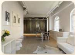
在東區大安路經營日本知名的小臉美顏沙龍「Facia」

台北東區，國際性的共同工作空間 (Coworking Space)-CONNECT致力於創造一個不受限的無國界工作環境，讓來自不同背景文化、國家、產業的工作者，能在這裡碰創出創意與成長。