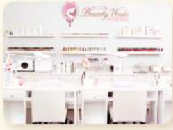
在東區地下街經營 美髮、美睫、美甲等項目的綜合沙龍