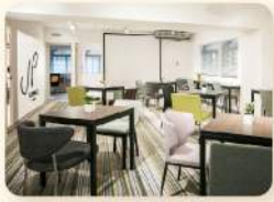
在東區忠孝東路以外國人為主要客群 經營共用空間、辦公室租借事業

「美人工場」-打造美人的工場，日本人經營的綜合美容沙龍引進與東京零時差的時尚美容技術，讓所有台灣女性變得更美麗，是我們的品牌目標。